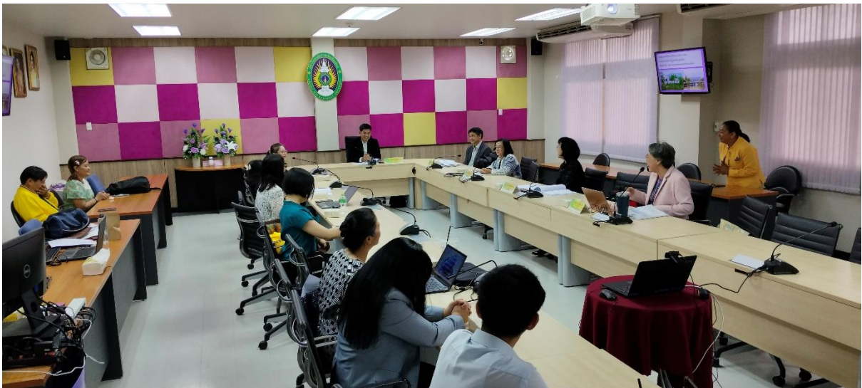
คณะกรรมการประเมินฯ สัมภาษณ์ผู้บริหารคณะ