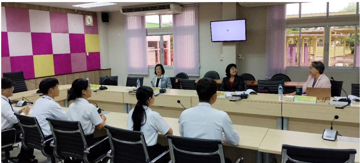
คณะกรรมการประเมินฯ สัมภาษณ์ตัวแทนผู้ใช้บัณฑิต ศิษย์เก่าและนักศึกษาปัจจุบัน