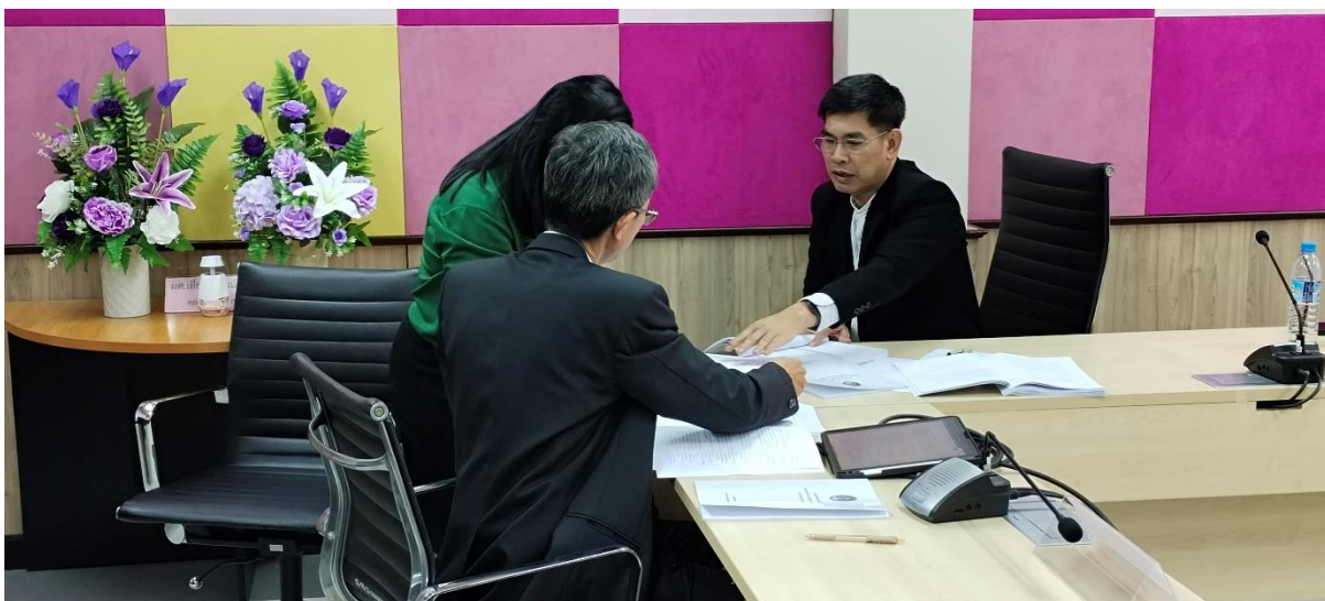
คณะกรรมการประเมินฯ สัมภาษณ์ผู้รับผิดชอบองค์ประกอบและตัวบ่งชี้