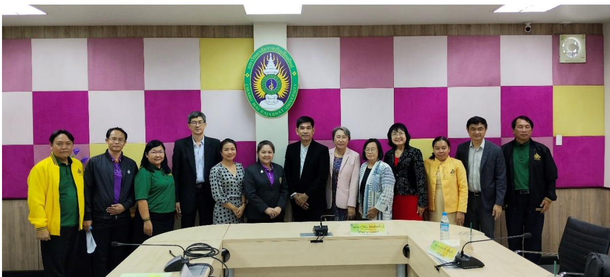
คณะกรรมการประเมินฯ และผู้บริหาร บุคลากร ถ่ายรูปร่วมกัน