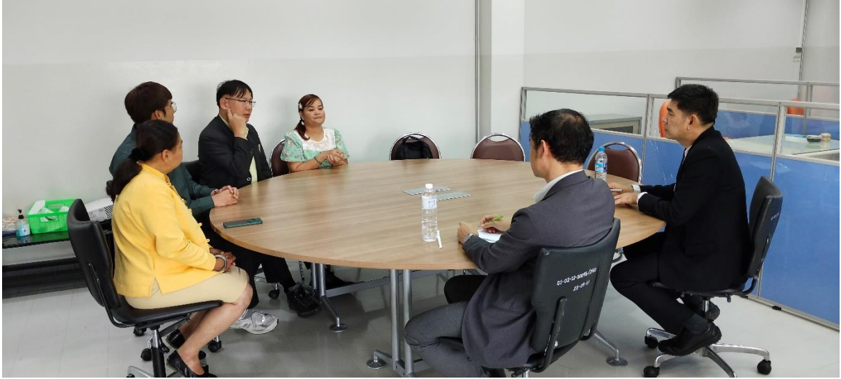
คณะกรรมการประเมินฯ สัมภาษณ์ตัวแทนอาจารย์