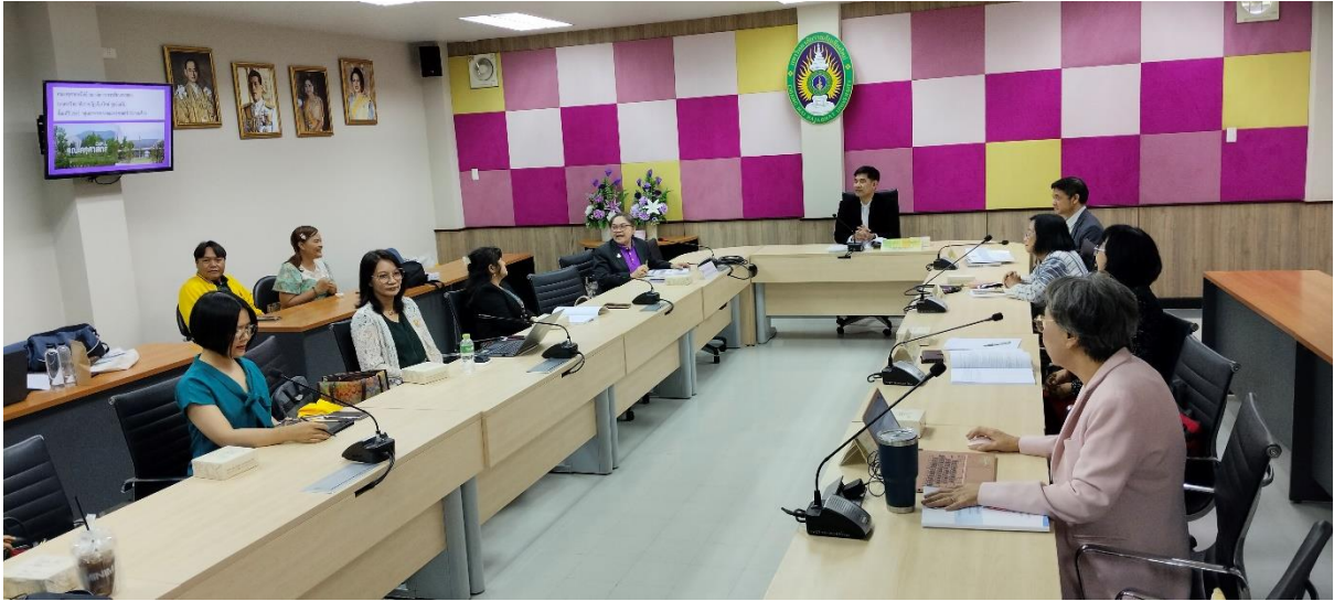
ผู้บริหารคณะต้อนรับคณะกรรมการประเมินฯ