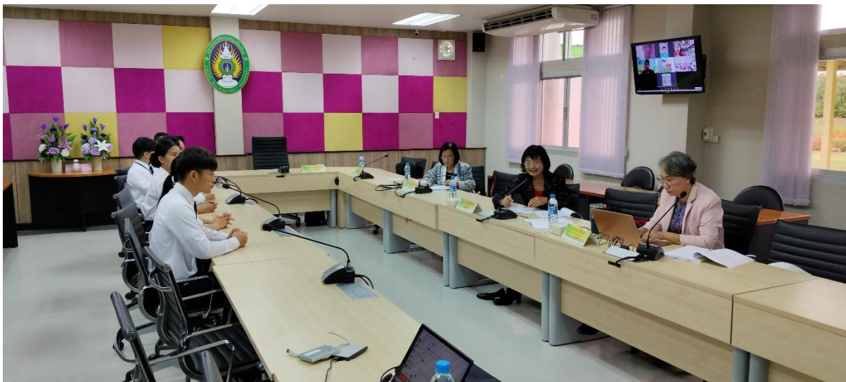
คณะกรรมการประเมินฯ สัมภาษณ์ตัวแทนผู้ใช้บัณฑิต ศิษย์เก่าและนักศึกษาปัจจุบัน