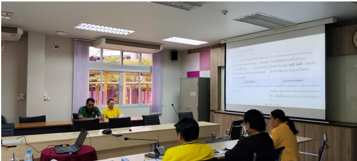
คณะกรรมการประเมินฯ นำเสนอข้อเสนอแนะให้กับผู้บริหารคณะ