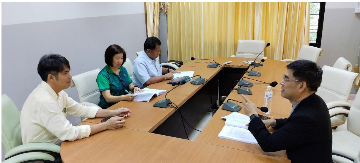
คณะกรรมการประเมินฯ สัมภาษณ์ผู้รับผิดชอบองค์ประกอบและตัวบ่งชี้