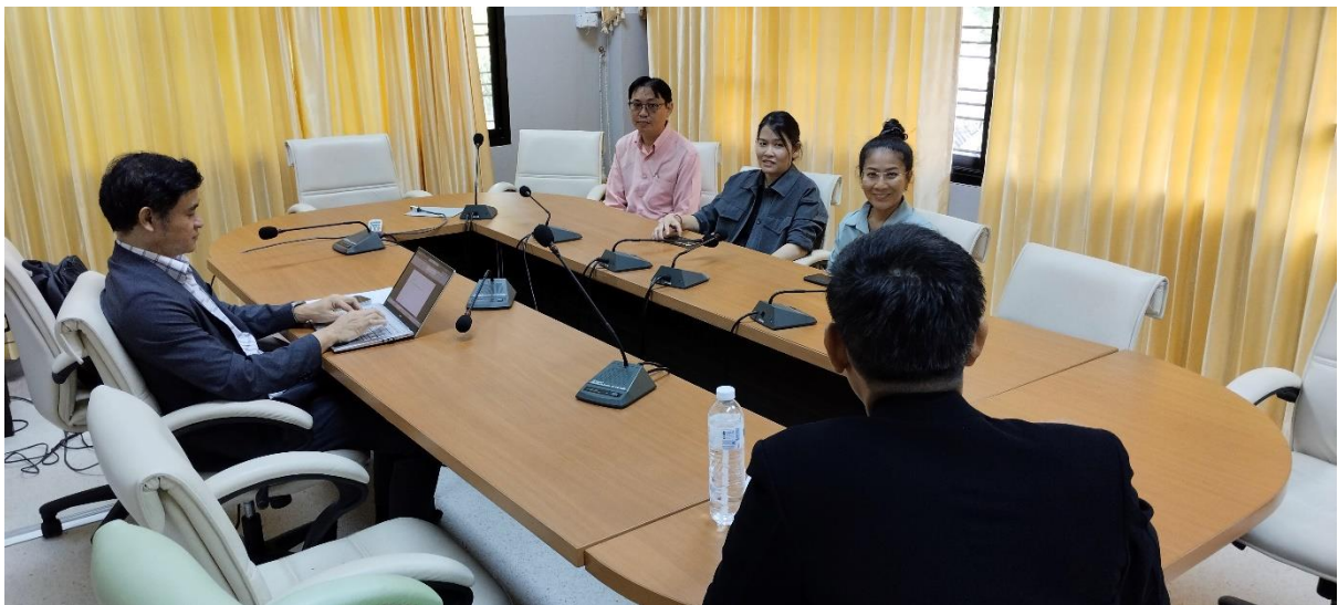
คณะกรรมการประเมินฯ สัมภาษณ์ตัวแทนอาจารย์