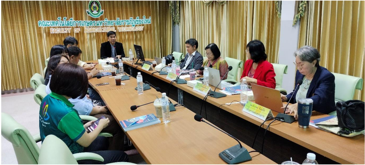
คณะกรรมการประเมินฯ นำเสนอข้อเสนอแนะให้กับผู้บริหารคณะ