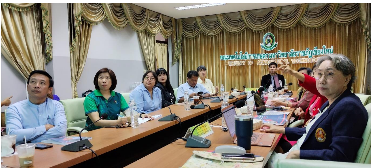
คณะกรรมการประเมินฯ นำเสนอผลคะแนนการประเมินให้กับผู้บริหารคณะ