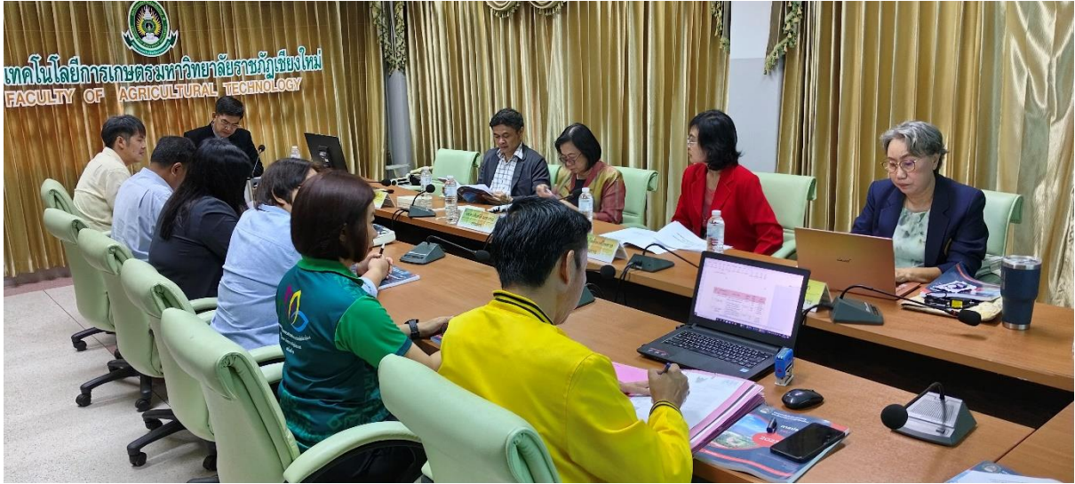
คณะกรรมการประเมินฯ สัมภาษณ์ผู้บริหาร