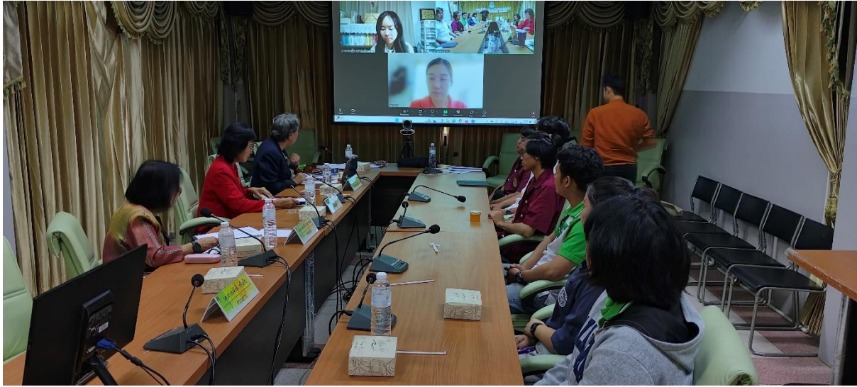
คณะกรรมการประเมินฯ สัมภาษณ์ตัวแทนผู้ใช้บัณฑิต ศิษย์เก่าและนักศึกษาปัจจุบัน